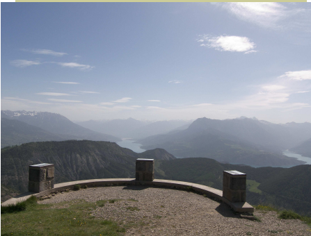
La table d'orientation

Office de Tourisme de la Communauté de Communes du Pays de Serre-Ponçon