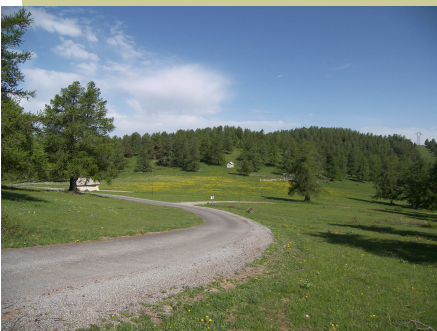
Le plateau et la cabane des bergers